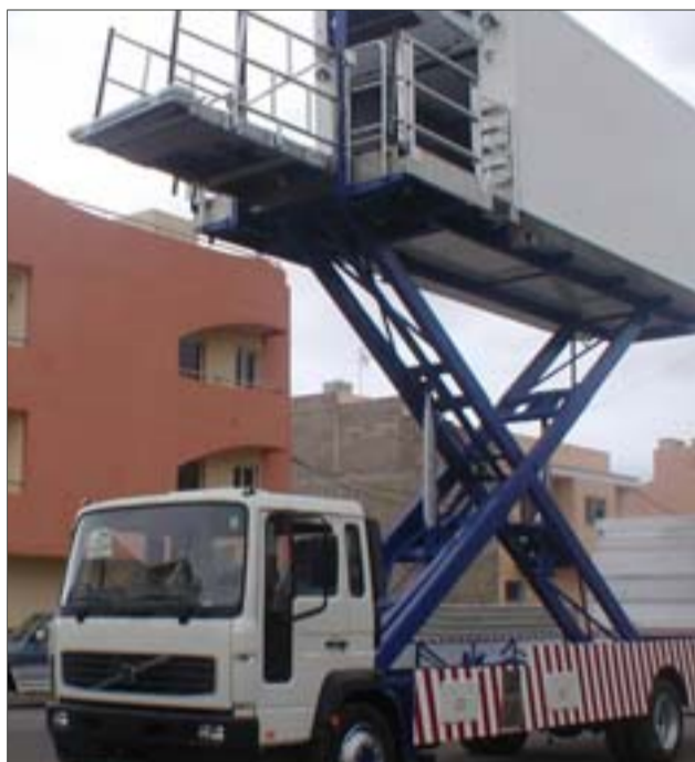
Vehículo con estructura especial fabricada por Grasaica.

a crear una filial en la Península, en Madrid, donde operó hasta que los atentados de las Torres Gemelas cambiaron por completo la concepción que antes se tenía del transporte aéreo de pasajeros, con crisis en muchas compañías y a lo que además se unió la desaparición del servicio gratuito de comidas en los vuelos, con brutal impacto en el "catering".